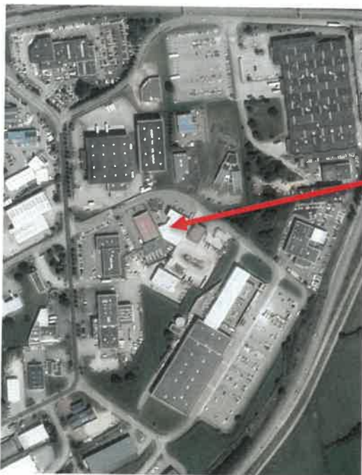
Emplacement de la MIROITERIE LEMASSON